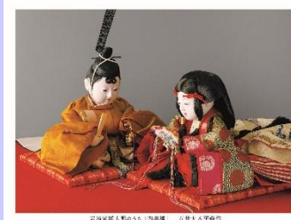
岩崎家雛人形のうち(内裏雛) 古津人吉平製作