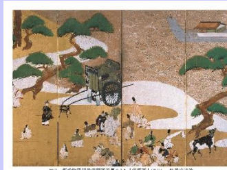
源氏物語関屋滯標図屏風のうち(滯標図)部分 俵屋宗達筆