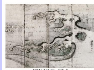
波図屏風のうち(右隻)部分 酒井抱一筆