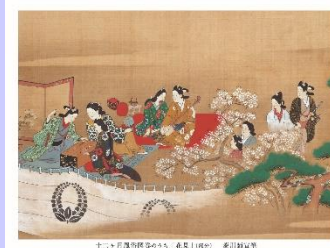
十二月月夜風俗図巻のうち(花見)部分 表川師宣筆