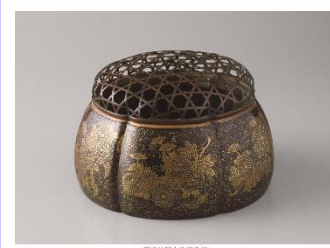
京春秘形古漆香炉