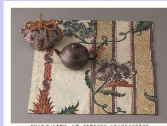
紫泥茶鉢 銘「萬豊順記」 仕覆：藍地銭菱手更紗、白地縞草花文金更紗袱紗