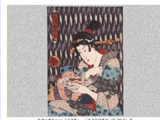
高級当世島のうち(金花糖) 三代目歌川豊国(歌川国貞)筆