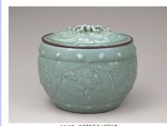
重要文化財 青磁浮牡丹文太鼓胴水指