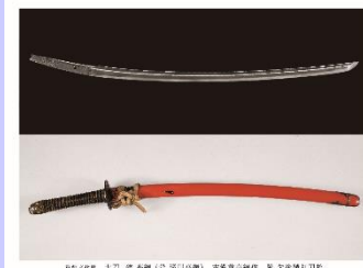
重要文化財 太刀 銘 高綱(号 滝川高綱) 古備前高綱作 附 朱塗鞘打刀拵