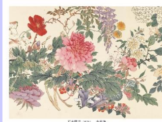
百花図巻(部分) 余崇筆