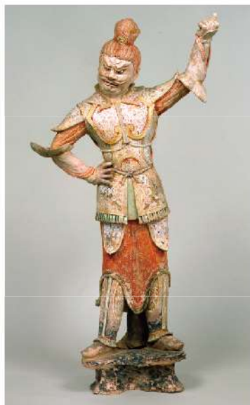
《加彩神将立像》 唐時代(7～8世紀)