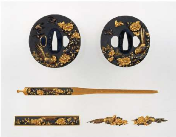
パリ万国博覧会(1900年/明治33)出品! 石黒是美《花鳥図 大小鐺・三所物》江戸時代(19世紀)