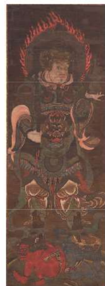
《毘沙門天像》 鎌倉時代(13世紀)