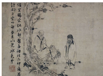
国宝 因陀羅《禅機図》元時代(14世紀)