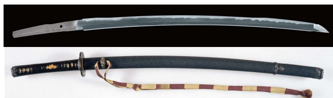
重要美術品 源清麿《刀 銘 源清麿/弘化丁未年八月日》江戸時代・弘化4年(1848)