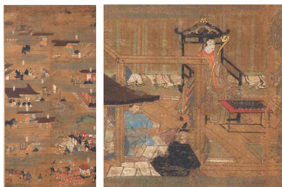
重要文化財《聖徳太子絵伝》鎌倉時代(14世紀)右は部分図