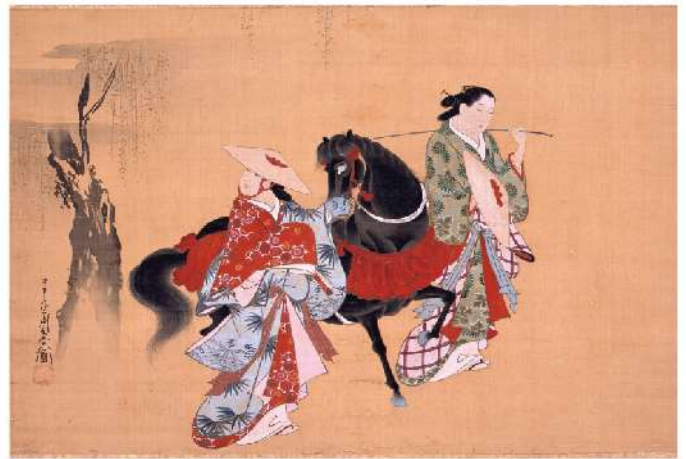
日英博覧会(1910年/明治43)出品! 宮川長春《形見の駒図》江戸時代(18世紀)