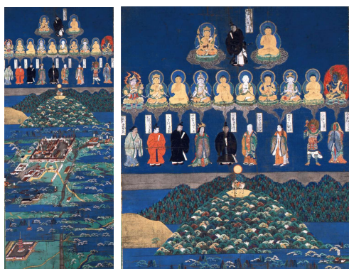
重要美術品《春日宮曼荼羅》南北朝時代(14世紀)右は部分図

古美術のなかの神さま、仏さま、そして人の姿に注目する入門展です。物語や和歌を主題としたやまと絵に描かれた人物、神さまを表現した絵、禅宗の人々を中心に愛好された道教や仏教の偉いお坊さんなどを描いた絵、中国の故事を題材にした絵などをとりあげます。「この人は誰?」「このポーズの意味は?」「何をしているところ?」——神仏と人物が表されときの約束事や背景にあるストーリーを、やさしく紐解きながらご紹介します。