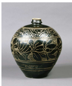
《黒釉線彫蓮唐草文梅瓶》 金～元時代(13～14世紀)