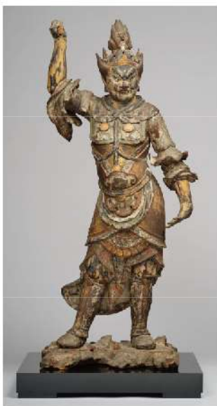
重要文化財 慶派 《木造十二神将立像のうち寅神像》 鎌倉時代・安貞2年(1228)頃

仏像のなかには、武装して目をいからせ、怒った表情を見せるものがあります。こうした仏像は、何のために、何とたたかっているのでしょうか。あるいは、何を護っているのでしょうか?本展では浄瑠璃寺旧蔵の十二神将立像(重要文化財)を中心に、武士と「たたかう仏像」の関係をご覧ください。また、神将像の鎧のルーツである中国・唐時代の神将俑を丸の内で初公開するほか、仏教絵画や刀剣等に表される多様な仏像の姿に注目します。