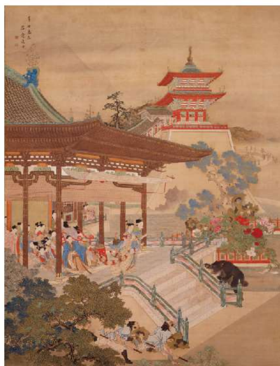
未来の国宝! 菊池容斎《馮昭儀当逸熊図》天保12年(1841)