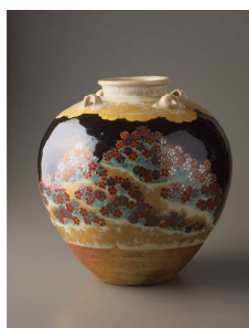
重要文化財 野々村仁清《色絵吉野山図茶壺》 江戸時代(17世紀)