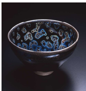
国宝《曜変天目(稻葉天目)》 南宋時代(12～13世紀)

中国陶磁の至宝、曜変天目。12～13世紀の南宋時代に作られ、世界に3点のみ現存し、全てが日本に伝わっています。多くの人々を魅了し続けているのは、漆黒の釉薬に浮かぶ虹色の光彩による謎めいた美しさでしょう。曜変天目はこの神秘的な輝きの他にも、製法や伝来などさまざまな謎を秘めています。本展では工芸の黒い色彩をテーマとして、刀剣や鉄鐺など「黒鉄(くろがね)」とよばれる鉄の工芸品や「漆黒」の漆芸品を紹介します。そして中国と日本の黒いやきものの歴史をたどりつつ、最新の研究成果をもとに、曜変天目が秘めるさまざまな謎と秘密にせまります。