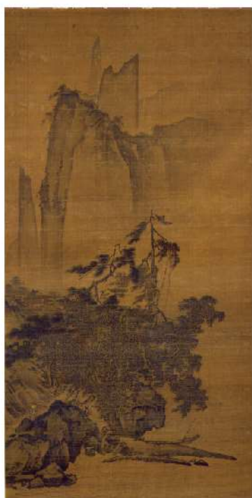
国宝 伝馬遠《風雨山水図》 南宋時代(13世紀)

静嘉堂@丸の内・開館3周年となる本展では、静嘉堂の東洋絵画の逸品が勢揃いします。大阪・関西万博2025にちなみ、20世紀初頭の博覧会に出品した岩崎家所蔵の光琳派や肉筆浮世絵、近代絵画などを皮切りに、国宝1件、重要文化財13件、博覧会出品作10件余りを一挙公開!そして未来の国宝!菊池容斎の破格の巨大絵画が丸の内に登場します。そのうち修理後初公開の重要文化財9件、重要美術品2件はいずれも室町時代の屏風や中国宋・元時代の貴重な作品です。筆墨の美や、見事な自然描写を、日中の作品を比較しながらご堪能いただけるのは静嘉堂ならではの。東洋絵画のメッセージを一步踏み込んで味わう機会となれば幸いです。