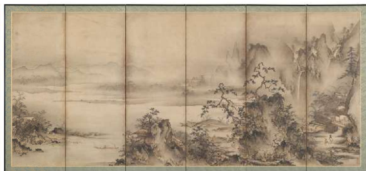
未来の国宝! 修理後初公開! 重要文化財 式部輝忠《四季山水図屏風》室町時代(16世紀)